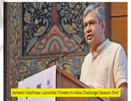
Ashwini Vaishnaw Launches 'Create In India Challenge-Season One'

(C) हाल ही में सूचना एवं प्रसारण मंत्री अश्विनी वैष्णव ने विश्व ऑडियो विजुअल एवं मनोरंजन शिखर सम्मेलन से पहले नई दिल्ली में क्रिएट इन इंडिया चैलेंज सीजन वन लॉन्च किया। इस अवसर पर बोलते हुए श्री वैष्णव ने कहा कि भारतीय अर्थव्यवस्था के विकास और तकनीकी प्रगति के प्रभाव को दर्शाते हुए 25 चैलेंज लॉन्च किए गए हैं। उन्होंने कहा कि मीडिया एवं मनोरंजन उद्योग भी विकसित हुआ है, जिससे क्रिएट अर्थव्यवस्था को काफी बढ़ावा मिला है।